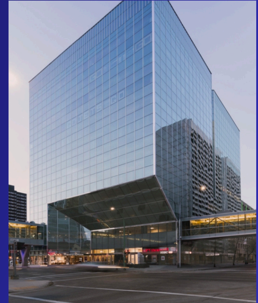
330 St Mary Ave Suite 300, Winnipeg MB R3c 3z5