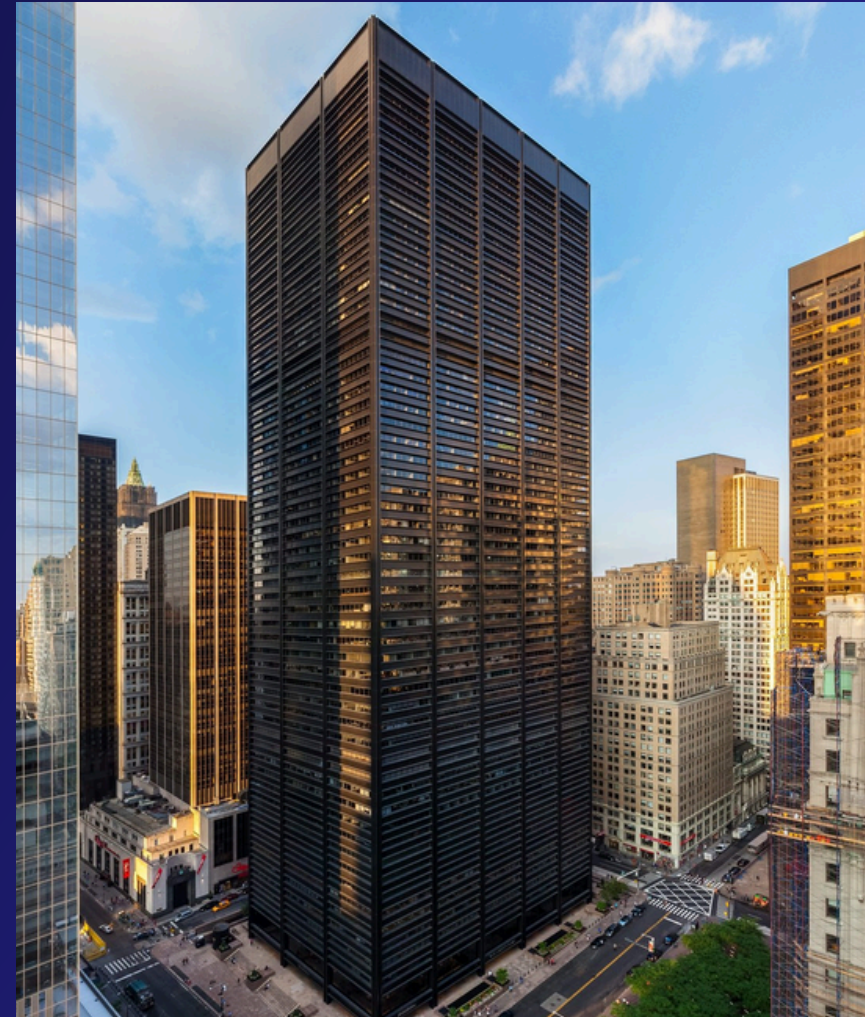
One Liberty Plaza, 165 Broadway, New York, NY 10006